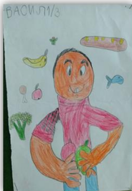
ВАСИЛ КОЈАДИНОВИЋ 1/3