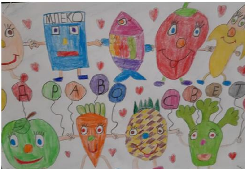
Матеја Дроца I-2